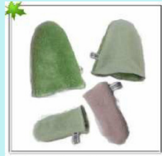
寶特瓶再生纖維 製造之手套