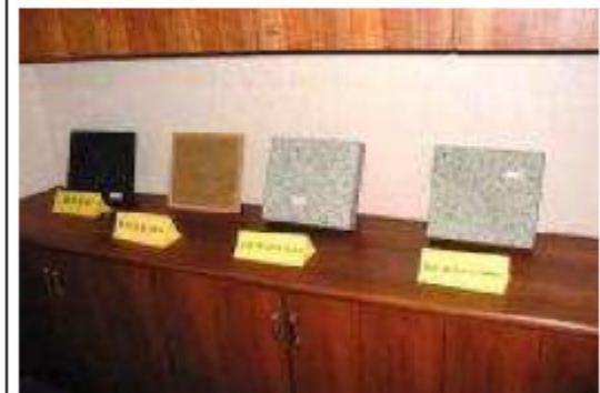
地磚、面磚、景觀石等建材