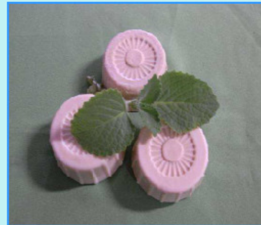
環保手工肥皂DIY教學成果