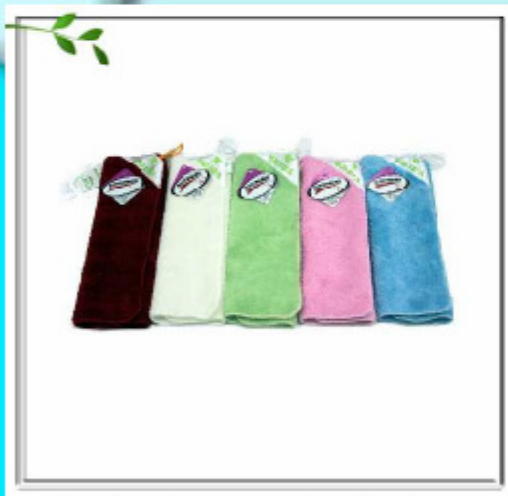
寶特瓶再生纖維 製造之環保抹布