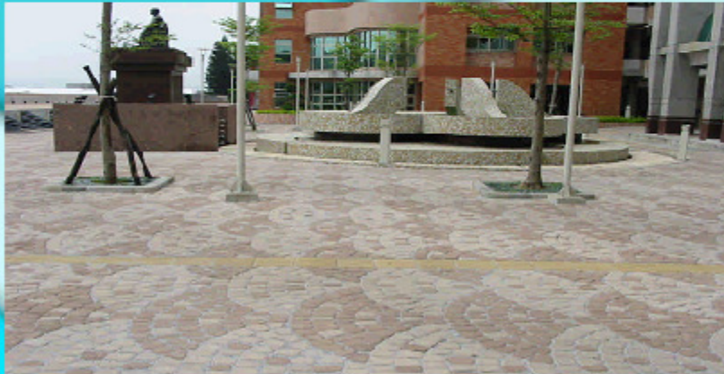
新竹大華技術學院