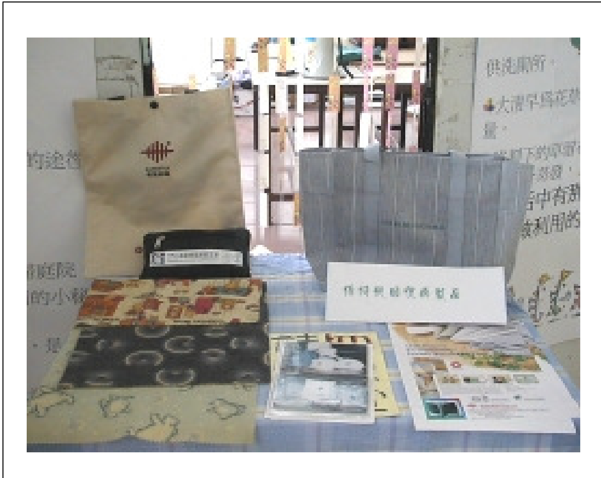
保特瓶回收再製品