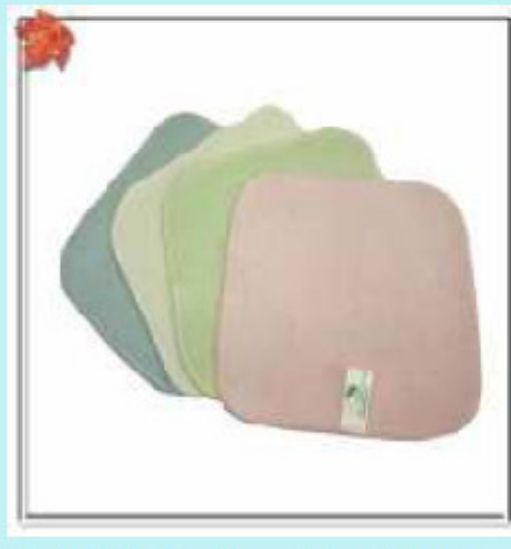
寶特瓶再生纖維 製造之洗碗巾